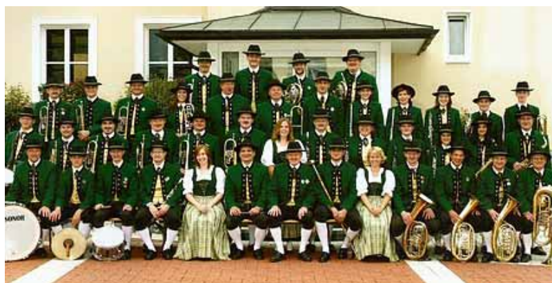
Foto: Musikkapelle heute